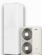
POMPES À CHALEUR AIR/EAU